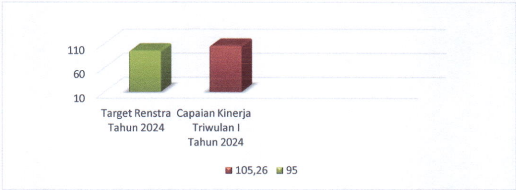
Diagram 1 Perbandingan Capaian Kinerja Kegiatan Operasi Intelijen Triwulan III Tahun 2024 Terhadap Target Renstra

Berdasarkan perbandingan di atas, maka terhadap Capaian Kinerja riIII, kinerja Triwulan III Tahun 2024 baru mencapai 105,26 %, sehingga dengan demikian capaian kinerja riIII Triwulan III tahun 2024 telah memenuhi target yang ditetapkan yaitu 95% .